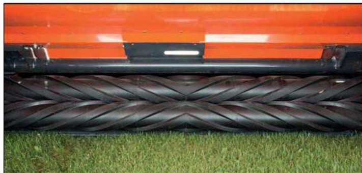
Teljes munkaszélességben egységes a szársértés